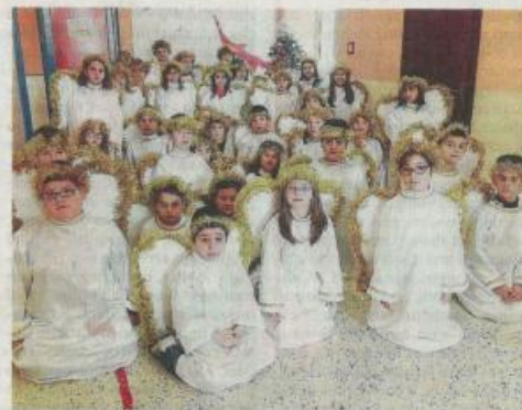
Una rappresentazione dei bambini a Marsala

Si tratta di una iniziativa della Pro Loco Marsala MTT 2.0 in collaborazione con il Comune di Marsala e con il supporto del main sponsor azienda Biotrading. Un mega evento che verrà presentato ufficialmente lunedì alle 18 nell'ex Convento del Carmine ed al termine del quale verrà anche offerta una apericena. Insomma Marsala si prepara al meglio a questo Natale che si prospetta «ricco» anche di visitatori.