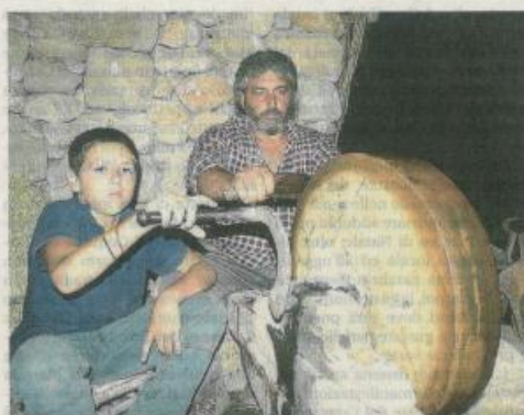
Si ripropongono anche gli antichi mestieri

che rendono "vivo" il presepe e che riproducono fedelmente luoghi sempre più rari ed antichi mestieri come "u scarparu", "u tilaru", "u furnu", "l'arbitrio per la pasta", "a taverna" e "u pignataro". Gli attori, come spiegano sempre gli organizzatori, sono per lo più uomini e donne di Custonaci o di paesi vicini che non interpretano i ruoli, ma vivono realmente delle situazioni di cui sono, o sono stati, protagonisti sino ad un passato recentissimo. Gli artigiani, inoltre, ripropongono in un contesto fuori dall'ordinario il mestiere che esercitano a Custonaci o in luoghi poco distanti: Buseto Palizzolo, Castelvetrano, Trapani, Valderice. Ogni anno sono migliaia i visitatori che arrivano per questa importante manifestazione.