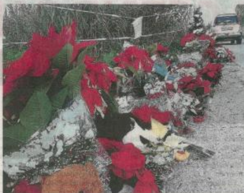
Nei mercatini anche tante stelle di Natale